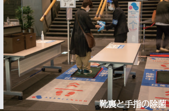
靴裏と手指の除菌