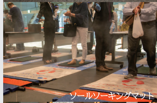
ソールソーキングマット