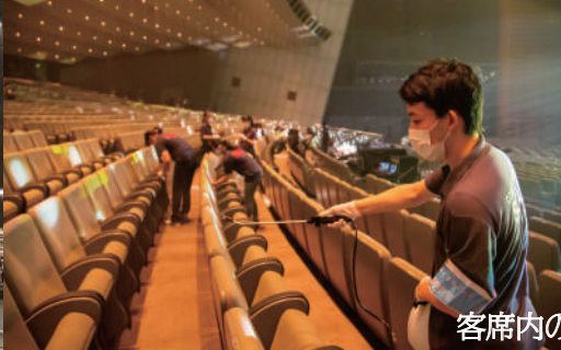
客席内の除菌風景